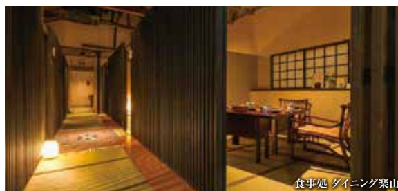
食事処 ダイニング楽山