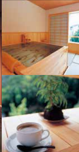
客室・温泉風呂の一例